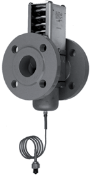
V46 二通压力驱动水 阀,法兰连接